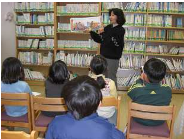
大きい子の読み聞かせ