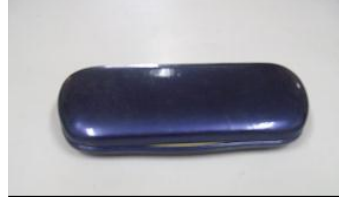
メガネケース 紫色 メガネは入っていません