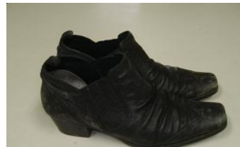
婦人物靴 黒 サイズ 22.5cm