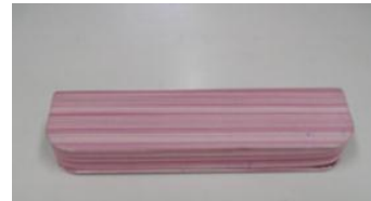
ピンクメガネケース メガネも入っています