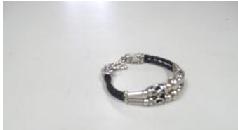
婦人物ブレスレット 金属製