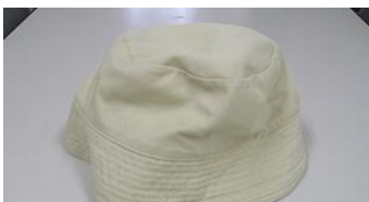
帽子 薄茶色 サイズ 不明