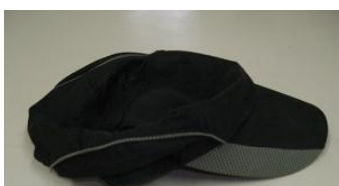
帽子 黒 サイズ 57～59cm