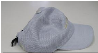
mont bell グレー 帽子 サイズフリー

お詫び ※印ドラえもんシリーズは10月購入分です。11月1日号のコミュニティだより掲載漏れでした。