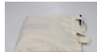
レインコート(ポンチョ風) クリーム色(婦人用?)