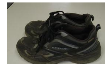
ダンロップ 運動靴 黒 サイズ25～26 cm位