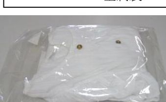
婦人物ブラウス 白

忘れ物コーナーからのお知らせ 事務所前、サロンに展示しておりますお忘れ物は、十二月二十三日以降お届けのないものについては処分いたします。お心当たりある方はコミュニティまでご連絡ください。※傘も多数あります。TEL(八四五)一一五五 コミュニティ事務所