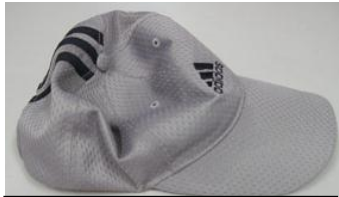
アディダス グレー 帽子 サイズ 57～60cm